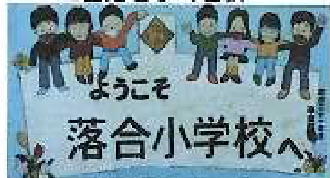
この看板が目印です