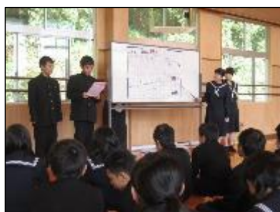
食に関する調べ学習発表会(総合)