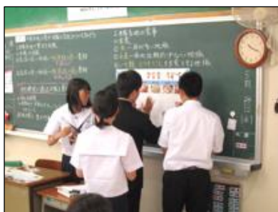
食に関する資料の整理(社会科)